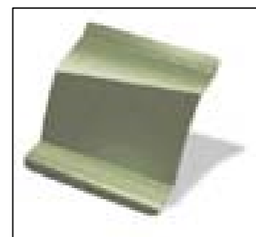
Olive - DXA (metalizata)