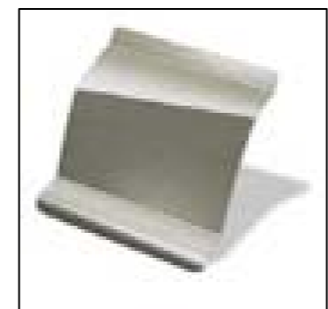
Sporty Silver - KXA (metalizata)