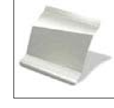
Pearl White - QXA (metalizata)