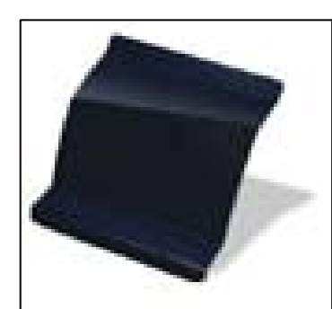
Solide Blue - RXB (nemetalizata)