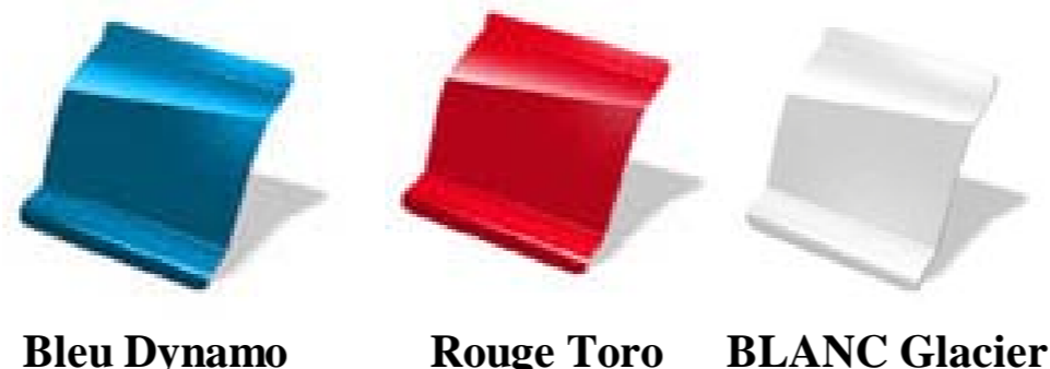
Bleu Dynamo Rouge Toro BLANC Glacier